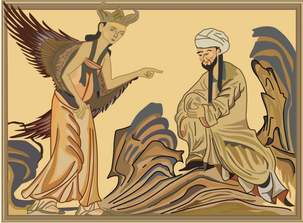
L'archange Jibril transmet le message d'Allah à Mahomet

La figure du prophète de l'islam est un obstacle majeur à son évolution.