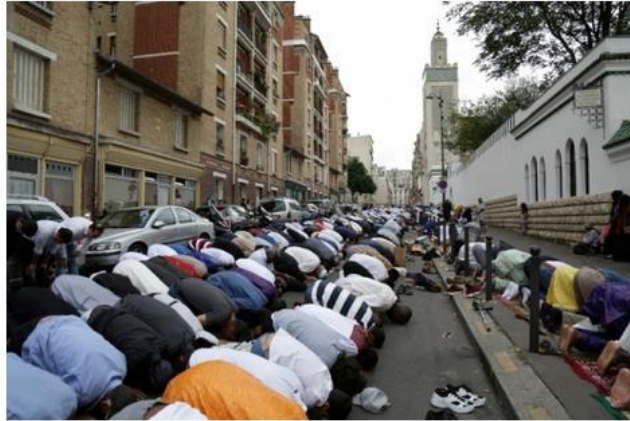
Titre et illustration: Tribune de Genève , 24 août 2017

L'ignorance est partout dans la presse. L'une de ses manies? Traiter chaque polémique en soi (burqa, foulards, burkini, prières, etc.) et non comme élément d'une stratégie globale. D'où cette expression burlesque à propos de l'étendard le plus efficace de la conquête culturelle: « Qu'est que ça peut vous faire que des femmes portent un fichu sur la tête? » Lorsqu'en 2016 les médias découvrent que deux adolescents refusent de serrer la main de leur enseignante, ils sont scandalisés, mais ne voient pas que cette pratique n'est qu'une note de la vaste gamme des rites fossilisés.